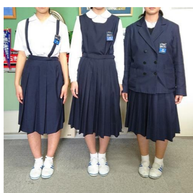
【Bタイプ】夏服・合服・冬服 (スカートの場合)