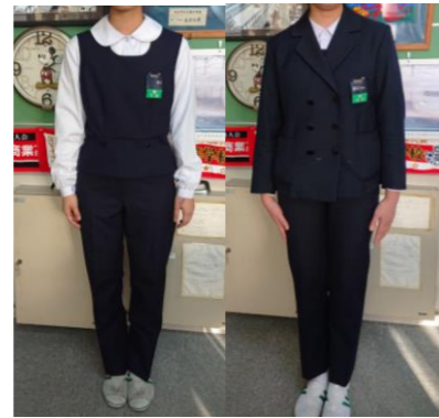
合服・冬服 (スラックスの場合)