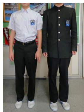
【Aタイプ】夏服・冬服