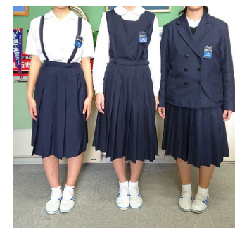
【女子】夏服・合服・冬服